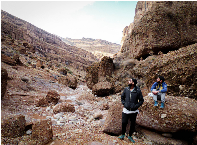
Près de Chiraz, Décembre 2016