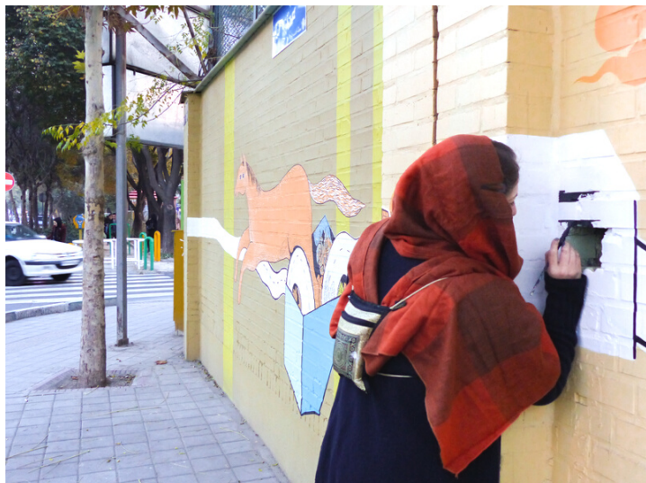
Ouest de Téhéran, Novembre 2016