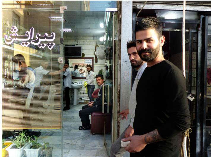
Sud de Téhéran, Novembre 2016