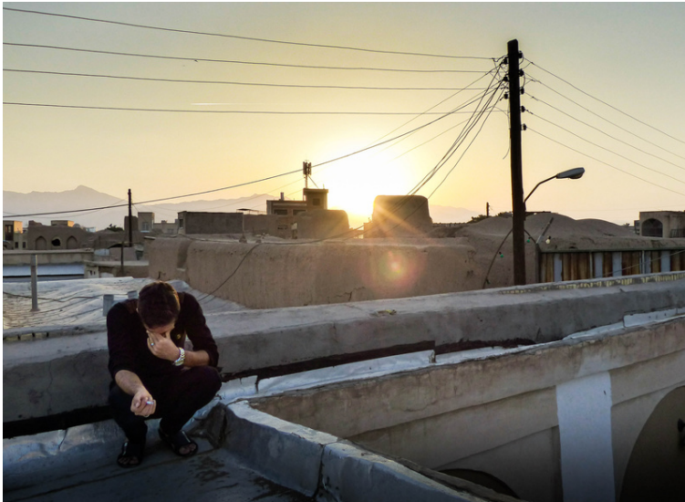
Centre ville de Kashan, Octobre 2016