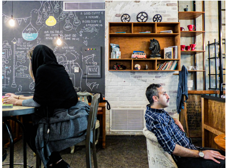
Centre de Téhéran, Décembre 2016