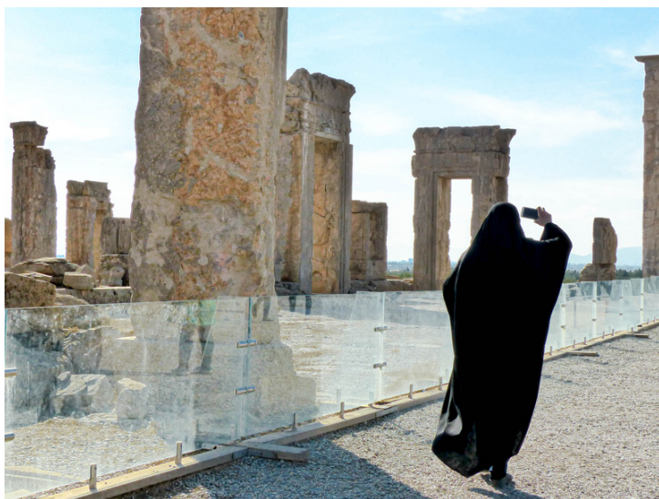
Site UNESCO de Persépolis, Novembre 2016