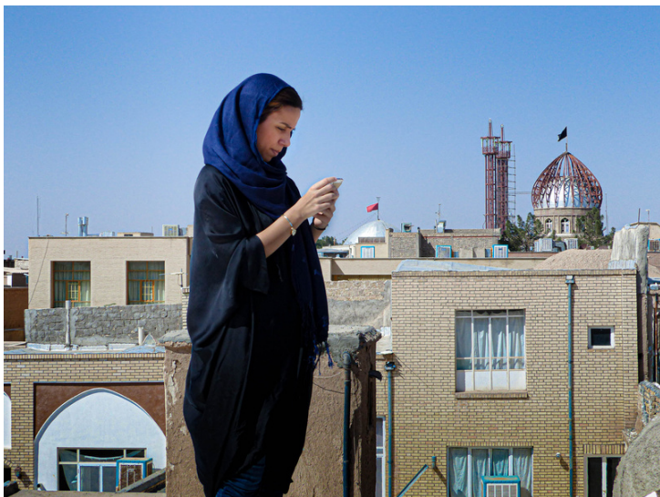
Centre ville de Kashan, Octobre 2016