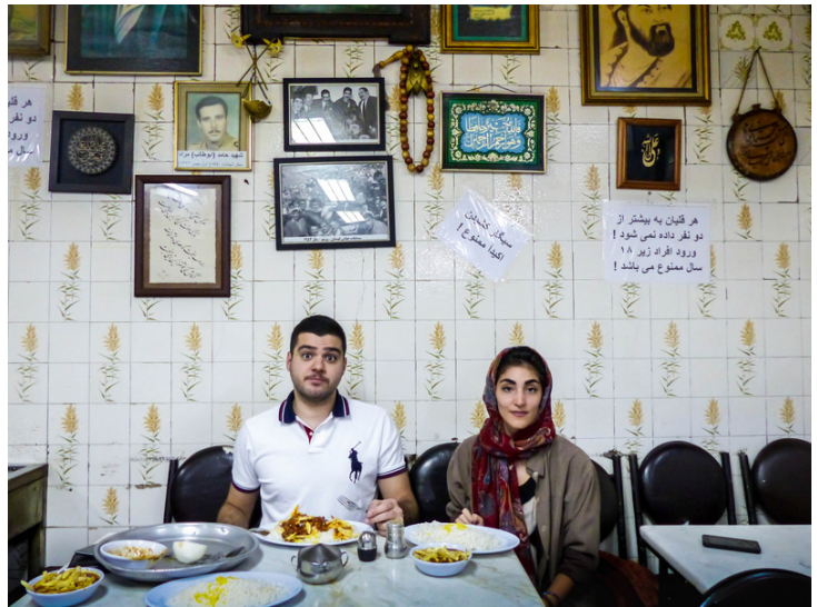
Nord de Téhéran, Septembre 2016