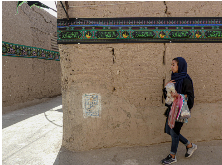
Centre ville de Kashan, Octobre 2016