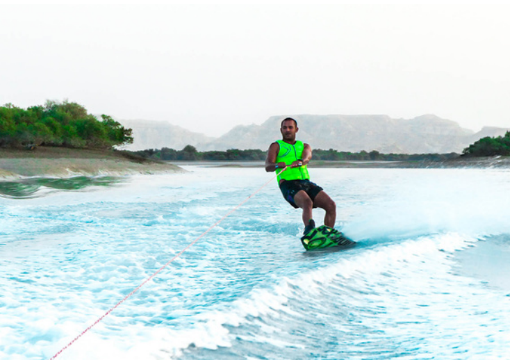
Ile de Qeshm, Novembre 2016